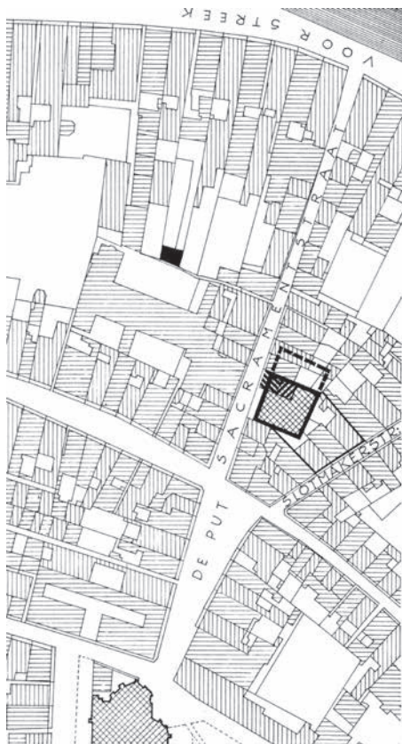
Afb. 50.1: Situatie van de Leeuwarder sjoel van 1805 naar het oudste kadastrale minuutplan, de vergroting van 1865 aangegeven met een gebroken lijn. Zwaar gearceerd is bij benadering de ligging aangeduid van het achterhuis, dat in of na 1745 tot sjoel was verbouwd, en van het voorhuis, dat tussen 1787 en 1791 voor uitbreiding van de sjoel was gebruikt. Omlind zijn verder de drie percelen aan de Slotmakerstraat, aangekocht in 1802-'03. In zwart is de plaats aangegeven van de sjoel voor 1745. Noorden links. (Tekening H.W. van der Voet)

Twee jaar later is de sjoel in gebruik, want de nieuwbenoemde rabbijn Nachman Levi is dan, zoals uit een processtuk van 1747 8 blijkt, gehuisvest 'in de Zakramentstraat