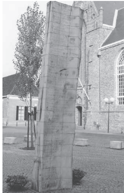
Links: tentoonstelling Drie eeuwen Joods leven in Friesland. Rechts: het Joods monument Leeuwarden.

Levissonstraat onthuld. In 1994 verscheen van de hand van Ype Schaaf een boek over Leeuwarden in de Tweede Wereldoorlog waarin een hoofdstuk 'Het Joodse Drama'. 5 Deze schrijver publiceerde al eerder over het vooroorlogse Joodse leven in de Leeuwarder binnenstad. 6 In 1995 vond een succesvolle tentoonstelling plaats bij Tresoar met als thema 'Drie eeuwen Joods leven in Friesland'. In samenhang met de tentoonstelling verschenen diverse publicaties. 7