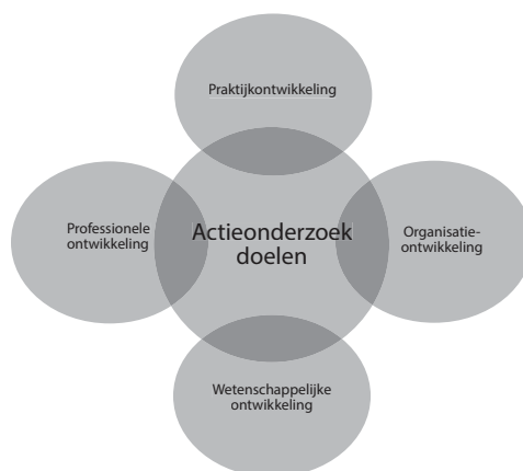
Figuur 1.1 Doelen van actieonderzoek